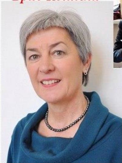
Международный Директор Эко-Школ